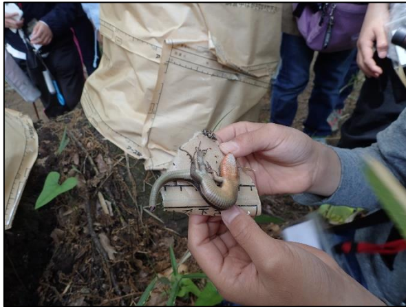
ナラ枯れホイホイに付いてしまったトカゲをレスキューし、放野した。