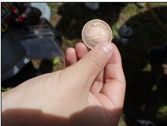
カタバミの葉で、10円玉を磨く。