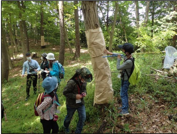
こもれびの森でナラ枯れについて観察する。