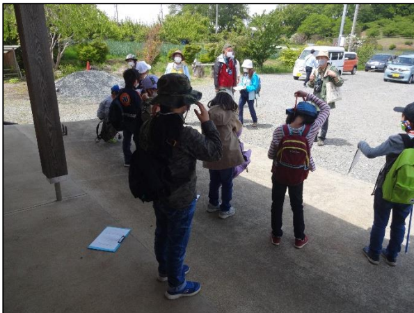
四季の里でまとめの話をする。