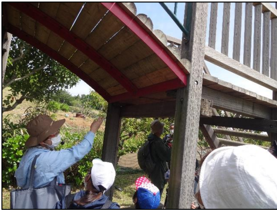
キムネクマバチの巣を観察。