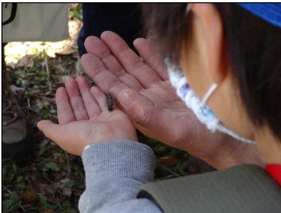
無毒の毛虫（クワゴマダラヒトリ） をリレーする。