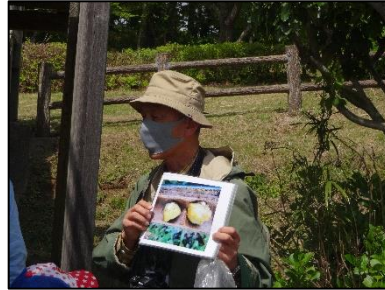
アシナガバチの産卵も観察。