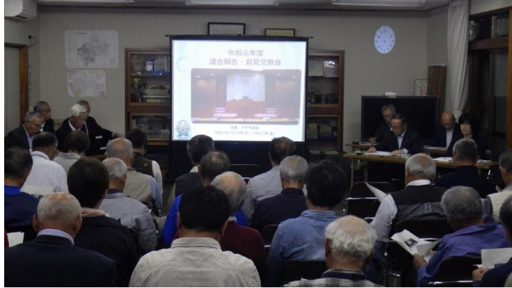
昨年の議会報告会の様子（西大井自治会館）