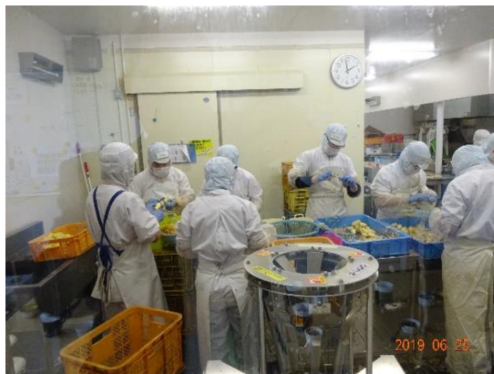
NPO 法人プロジェクトめむろでのジャガイモ剥き

2つ目のテーマであります「障がい者の就労支援」は12月より活動を開始しておりますが、その前に昨年北海道芽室町の「NPO法人プロジェクトめむろ」と「(株)九神ファームめむろ」を視察しております。ここではスーパーで売られているポテトサラダのジャガイモ皮剥き作業現場を視察しました。作業者の集中力にはビックリいたしました。そして「学校現場における現状と課題」が一区切りついた12月より再活動を開始しました。