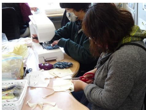
NPO 法人 KOMNY でのマスク作り