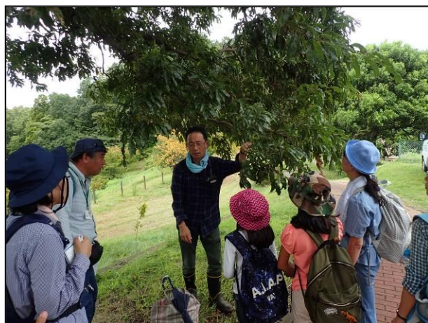
クヌギには虫こぶのクヌギエダイガフシがつく。