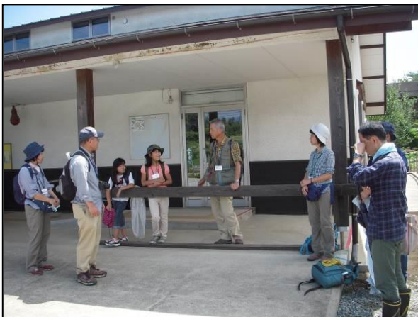
参加者の感想を聞く。