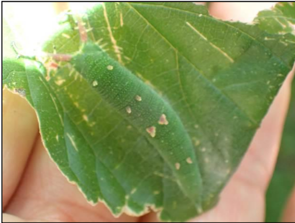
エノキの若木に外来種のアカボシゴマダラの幼虫が目立った。