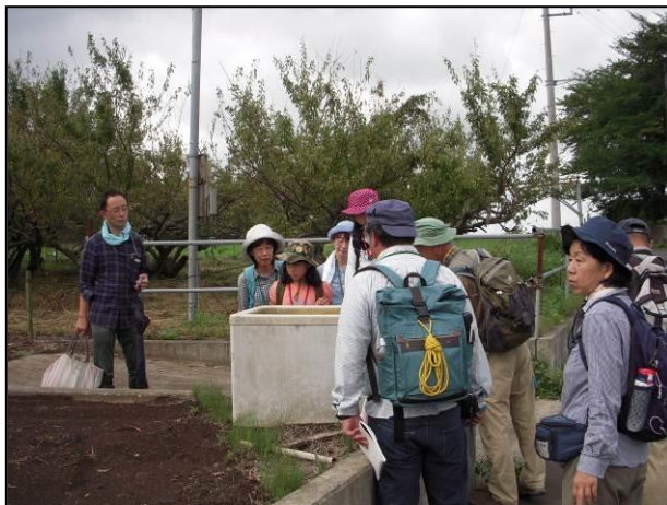
水槽の中にユスリカとマツモムシ