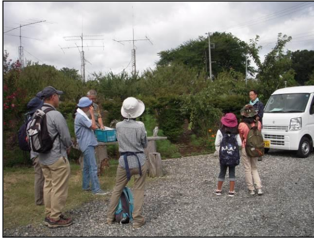
講師紹介と講師のあいさつ。