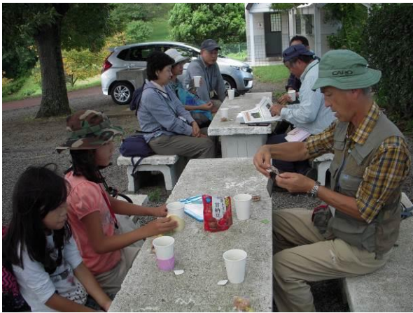
休憩をしていたら、クヌギからアオイラガの幼虫が落ちてきた。