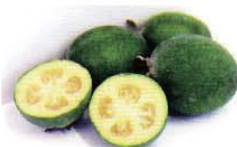
【詳しく知りたい方は】「あしがら旬感スイーツ」で検索 (大井町HP)

「フェイジョア」は、南米原産で見た目は梅、味と香りはパイナップルに似ているフルーツ。地元ではかつてみかんに次ぐ生産量を期待されましたが、思うように人気が出ませんでした。そんなフェイジョアに目を付けたのが、町内のシェフや菓子職人。フェイジョアを使ったケーキやまんじゅうなどを次々に開発すると大好評に。新しいご当地スイーツを、ぜひ味わって。