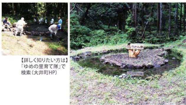
【詳しく知りたい方は】「ゆめの里育て隊」で検索 (大井町HP)

かつて荒廃しつつあった山林を、花が咲き乱れる夢のような里山に変身させたのは、地元住民の地元愛とパワーでした。その名も「ゆめの里育て隊」。約19ヘクタールもの広大なエリアに広がる、冒険心をくすぐる散策路やバラエティ豊かな花木の植生は、彼らの自由なアイデアと驚くべき団結力による「手づくり」! まるで里山のテーマパークのようなこの園は、実は今なお進化中。次に訪れたときには、新しい「何か」ができていないかも。歩くだけでは物足りない人は、「ゆめの里育て隊」に一度参加してみても?